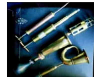
Claxons en vetspuiten uit de koperen tijd van de auto liggen in Ezinge te pronken.