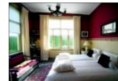
De slaapkamers voor de gasten ademen een nostalgische Engelse sfeer.