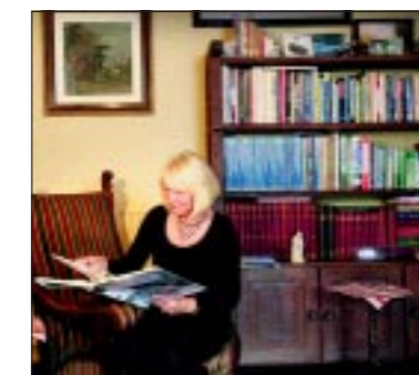
De bibliotheek met boeken over allerlei vormen van transport.