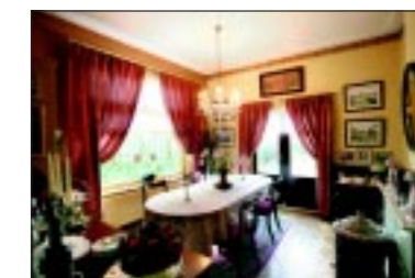
Het in jaren twintig stijl ingerichte ontbijtvertrek voor de gasten van de Wolseley lodge.